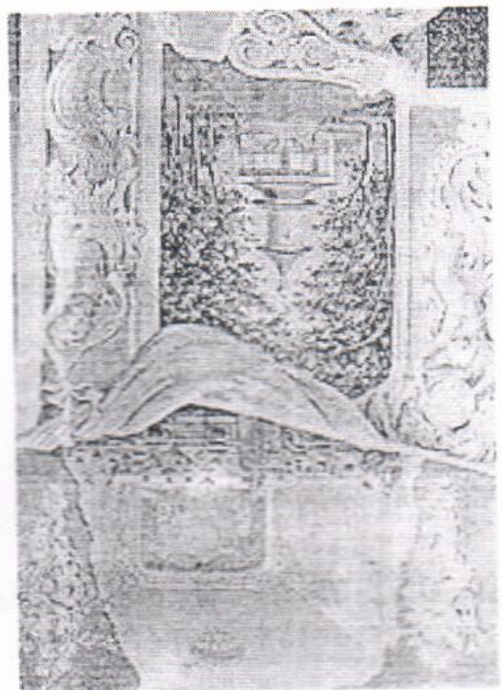
Остановка №10 Беседка