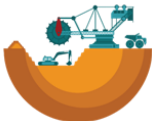
Добыча полезных ископаемых